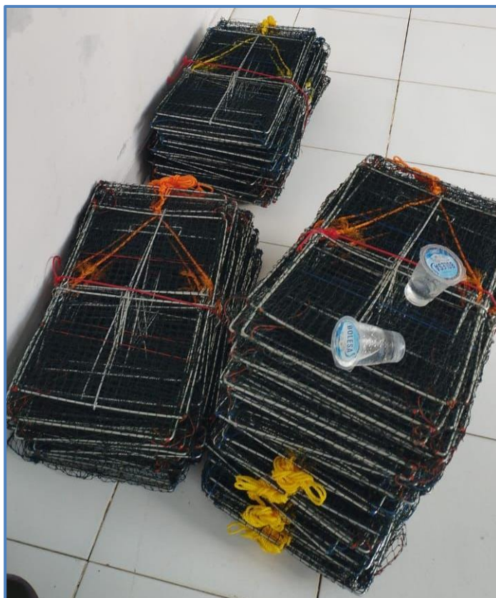
Gambar 4. Alat tangkap bubu liput

Bubu merupakan alat tangkap yang berbentuk kurung, ikan dapat masuk tetapi tidak dapat keluar karena bentuk bubu bagian dalam semakin mengecil yang berbentuk corong. Perangkap memiliki sifat pasif, dibuat dari anyaman rotan, anyaman kawat, anyaman bambu, karet bambu, seperti bubu dan sero yang terbuat dari anyaman bambu (Lino, 2013). Bubu liput merupakan alat tangkap yang banyak digunakan oleh nelayan untuk menangkap kepiting. Bubu liput mulai digunakan oleh nelayan untuk menangkap rajungan pada awal tahun 2000. Desain bubu yang ideal akan menambah efektivitas dan keramahan lingkungan penangkapan kepiting bakau dengan bubu liput. Bubu yang ideal adalah bubu yang mampu menangkap kepiting bakau dalam jumlah banyak dan ukuran yang besar (efektif dan ramah lingkungan) sehingga memiliki nilai ekonomis tinggi (Susanto dan Imawati, 2012).