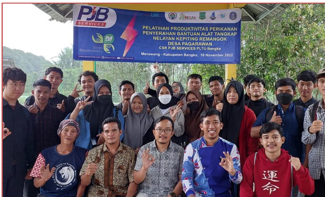
Gambar 1. FGD Prodi Perikanan Tangkap UBB dengan Kepala Desa Pagarawan, Becak Babel dan Kelompok Nelayan Bubu Sungai Selindung 11 November 2022.

Pada tahun 2022, Prodi Perikanan Tangkap telah melakukan FGD (Focus Grup Discussion) dengan menjangkau berbagai isu kegiatan perikanan khususnya perikanan tangkap nelayan Sungai Selindung. Di dapat hasil permasalahan utama yaitu terdapat penurunan produksi hasil tangkapan kepiting bakau dan udang. Selain itu, teknologi yang tradisional dan rendahnya kapasitas nelayan sungai terkait penangkapan yang ramah lingkungan menjadi isu prioritas dalam kegiatan tersebut.